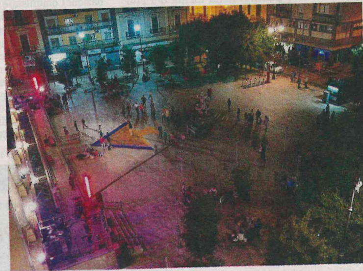
UNA STRADA DA FAR RIVIVERE Piazza Risorgimento, cuore di via Manzoni, animata con le tre serate dell'iniziativa di Pop Hub